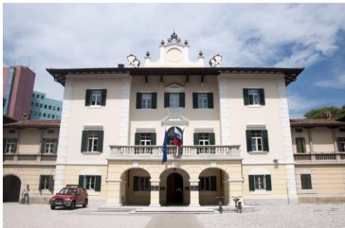
Dvorec Coronini, Vir: Občina Šempeter-Vrtojba.