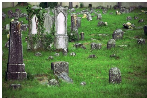
Judovsko pokopališče, Rožna Dolina.

Turistične ogledje je finančno podprla Mestna občina Nova Gorica in so zato brezplačni. Za prehod meje je obvezen veljaven osebni dokument (potni list, osebna izkaznica). Obvezne so rezervacije do zasedbe prostih mest na GSM: 040 577 255 ali e-pošto: evelin.bizjak@gmail.com .