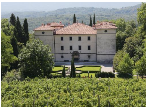
Grad Kromberk, Vir: MONG.

Turistične ogledje je finančno podprla Mestna občina Nova Gorica in so zato brezplačni. Za prehod meje je obvezen veljaven osebni dokument (potni list, osebna izkaznica). Obvezne so rezervacije do zasedbe prostih mest na GSM: 040 577 255 ali e-pošto: evelin.bizjak@gmail.com.