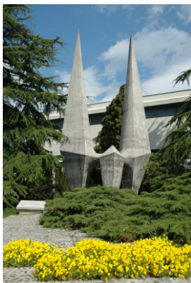
Spomenik Edvardu Rusjanu