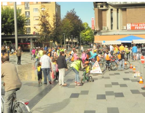
ETM 2014

- predstavitev zmogljivih električnih gorskih koles zadnje generacije in možnost testne vožnje (electrocollis).