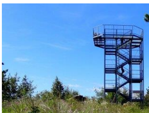
Škabrijel, Vir: TIC Nova Gorica

Organizator: Društvo Soška fronta 1915-1917 v sodelovanju z Mestno občino Nova Gorica.