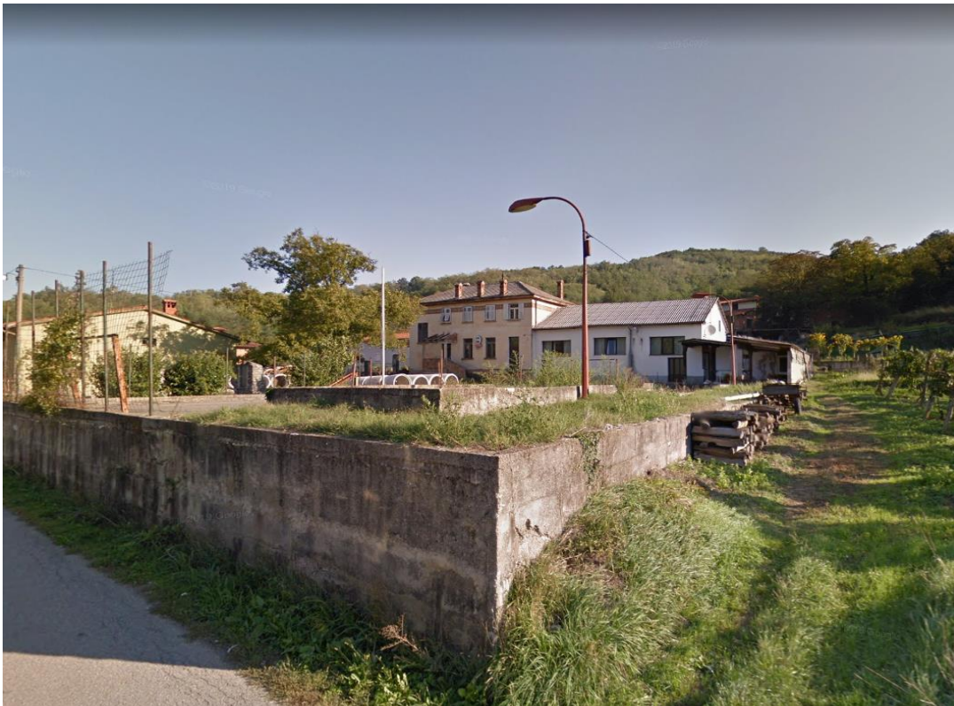
Objekt in zemljišča, ki so predmet projekta, Vir: Google Maps.

Projekt obsega zemljišča s parc. št. *421/1 (ID 1075043), *421/2 (ID 3257940) in 2316/2, vse k. o. 2664 Spodnja Branica, ki so v lasti KS Branik.