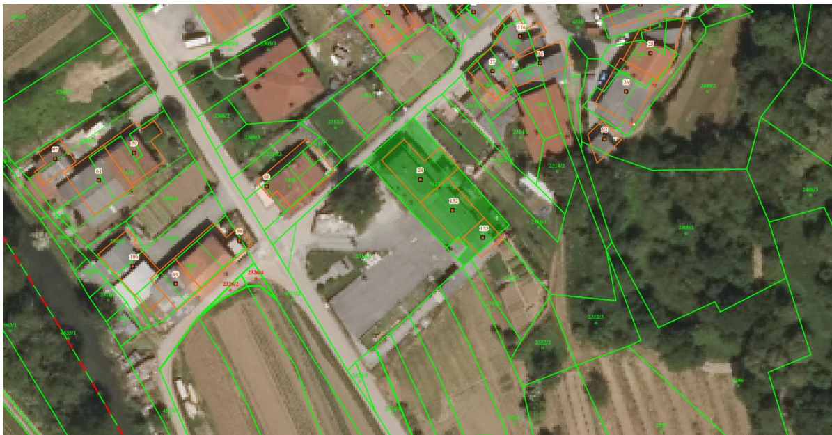
Ortofoto posnetek lokacije objekta, Vir: Portal E-prostor.

Projekt obsega zemljišča s parc. št. *421/1 (ID 1075043), *421/2 (ID 3257940) in 2316/2, vse k. o. 2664 Spodnja Branica, ki so v lasti KS Branik.