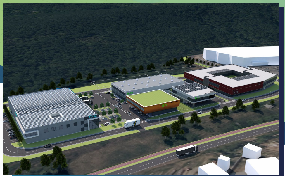
Koncept in vizualizacija CSE PROJEKT d.o.o. (Janez Pregrad)