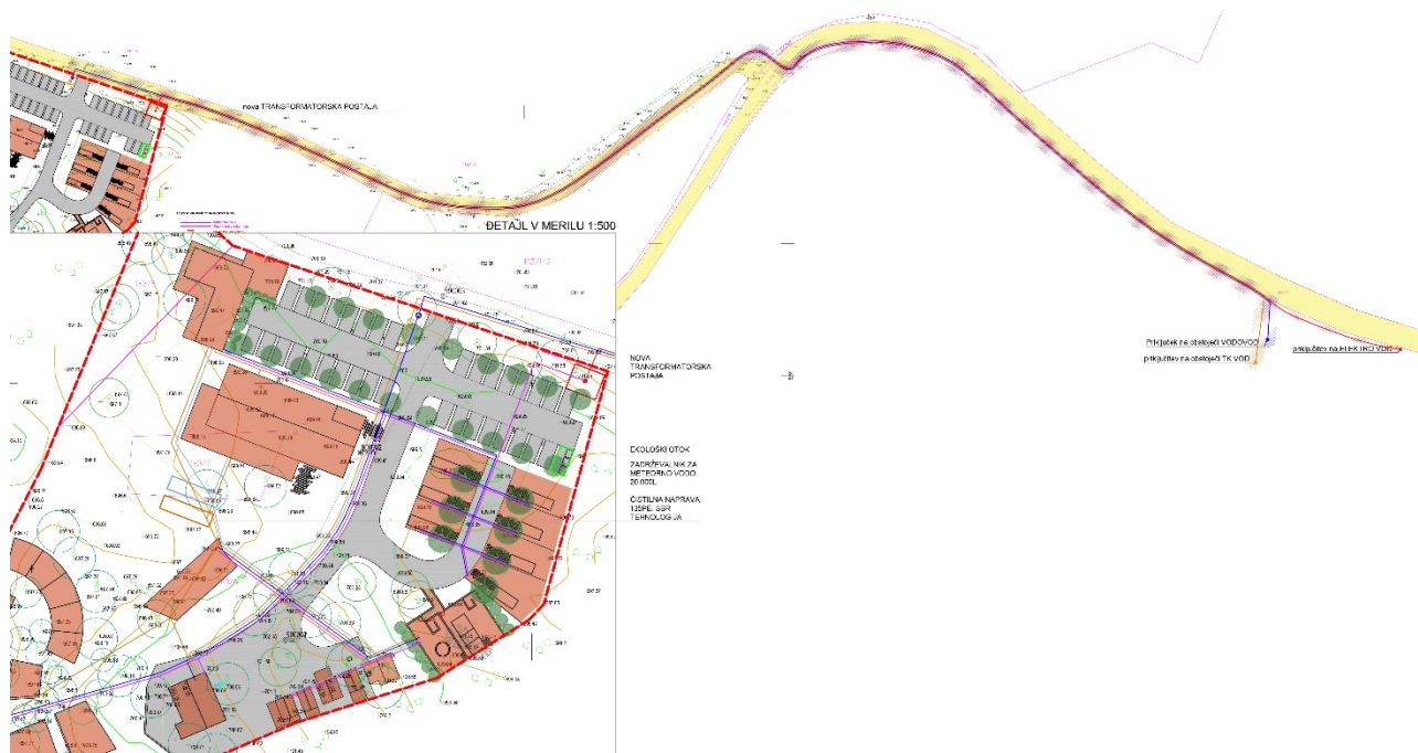
Slika 3: Območje OPPN s prikazom načrtovane GJI

zviševanja ali zniževanja globine infrastrukturnega voda od predpisane ter deponirati gradbeni ali drugi material ter postavljati začasne objekte. Na mestih, kjer so predvidene vozne površine, na mestih križanj z drugimi infrastrukturnimi vodi in v primeru izvajanja del v njihovem varovalnem pasu, se obstoječe vode ustrezno zaščititi.