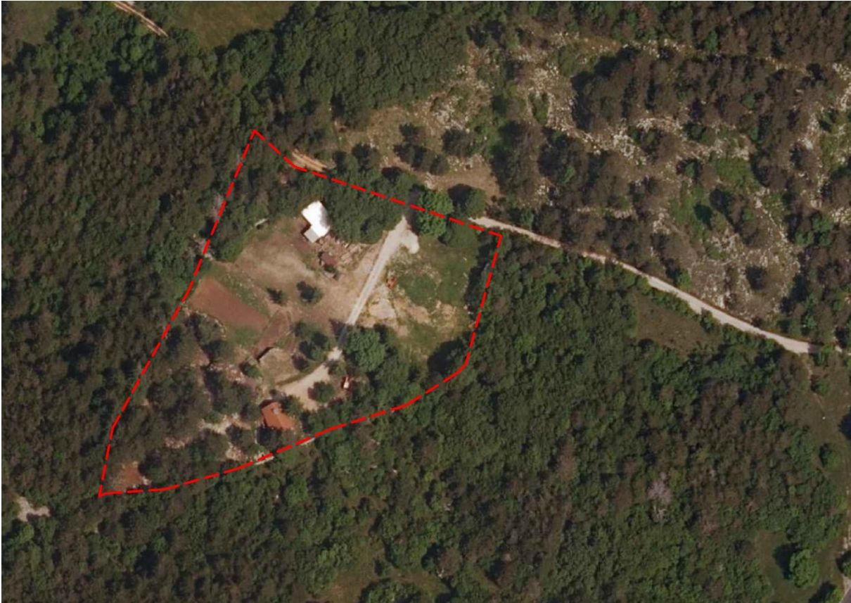
Slika 1: območje OPPN