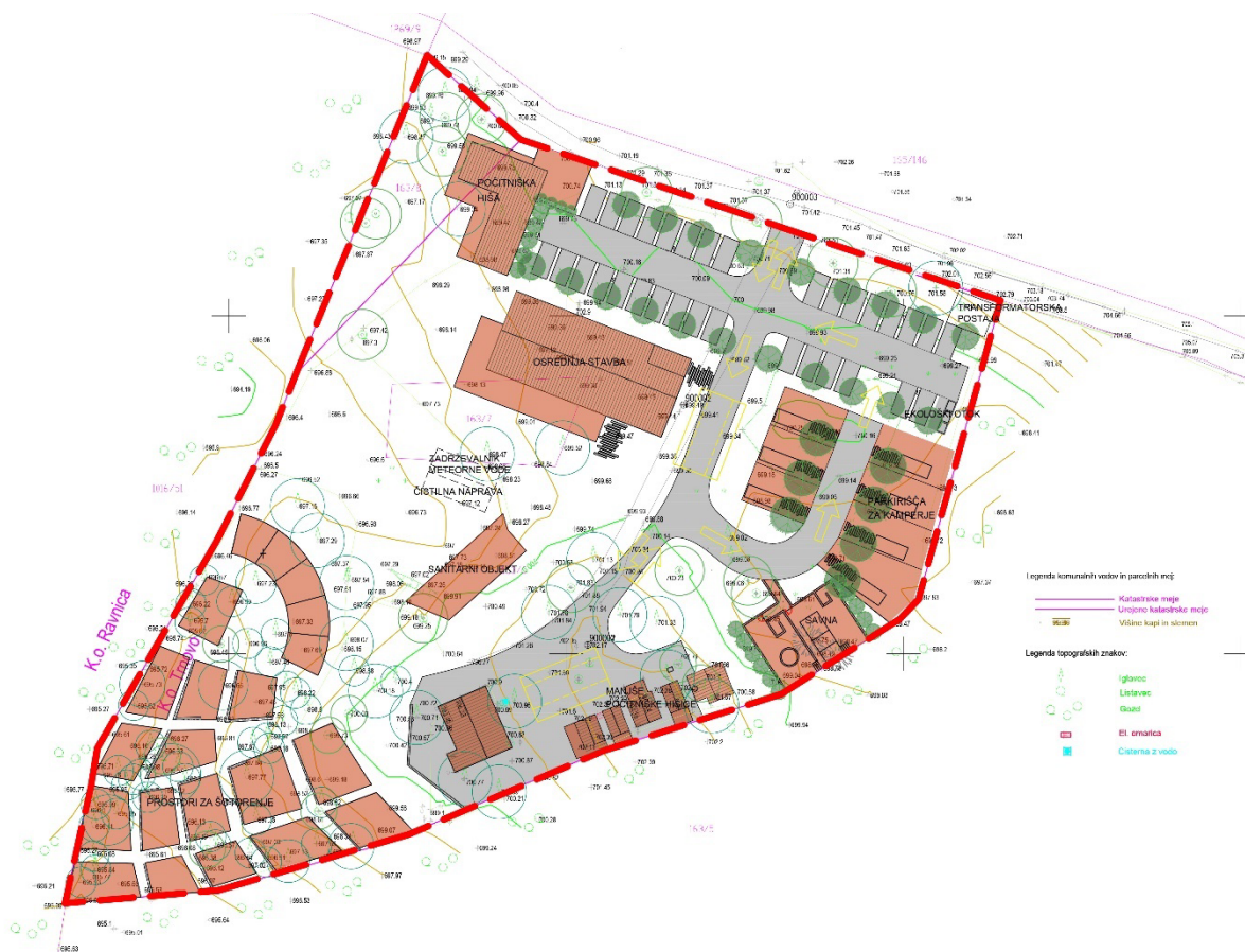
Slika 2: Ureditvena situacija