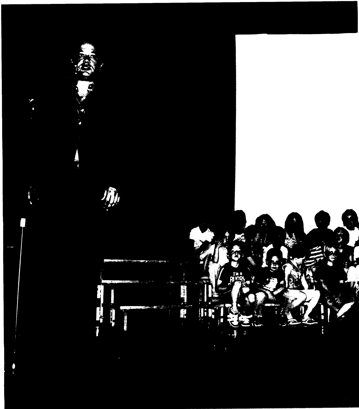
PODELITEV ZAHVAL PROSTOVOLJCEM 2011