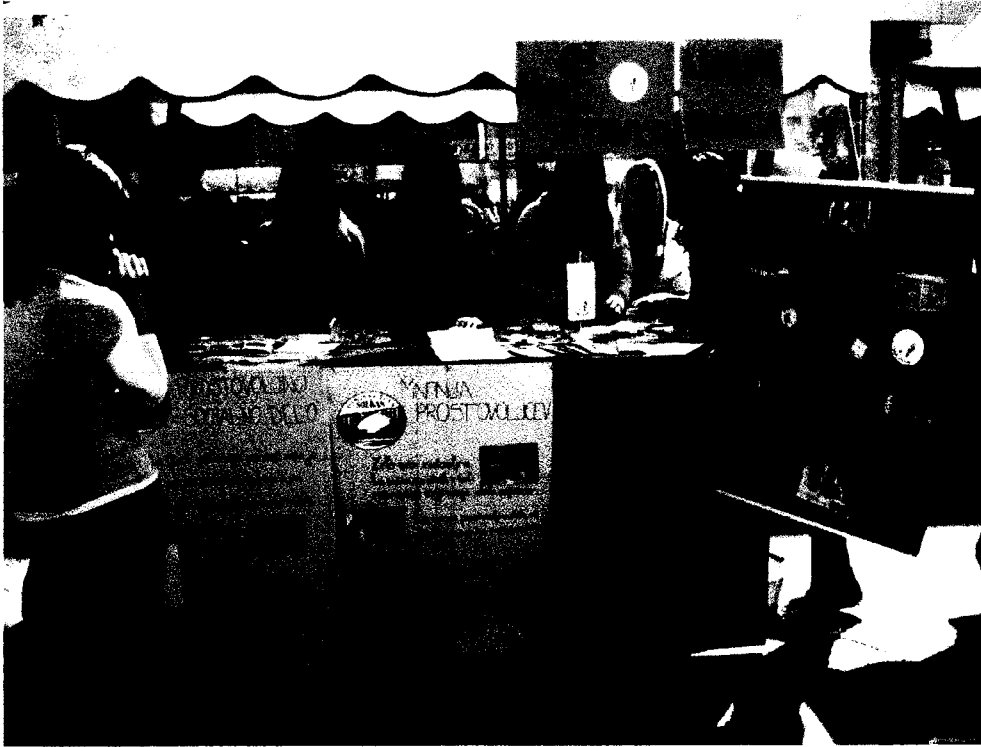
FESTIVAL PROSTOVOLJSTVA 2008